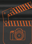
FOTO & VIDEO